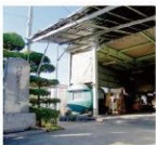
八代醸造 山梨県笛吹市八代町北1603 ☎ 055-265-2418