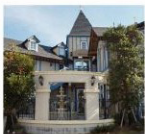
アルプスワイン 山梨県笛吹市一宮町狐新居418 ☎ 0553-47-0383