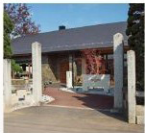
ルミエール 山梨県笛吹市一宮町南野沢624 ☎ 0553-47-0207