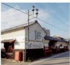
矢作洋酒 山梨県笛吹市一宮町上矢作606 ☎ 0553-47-2170