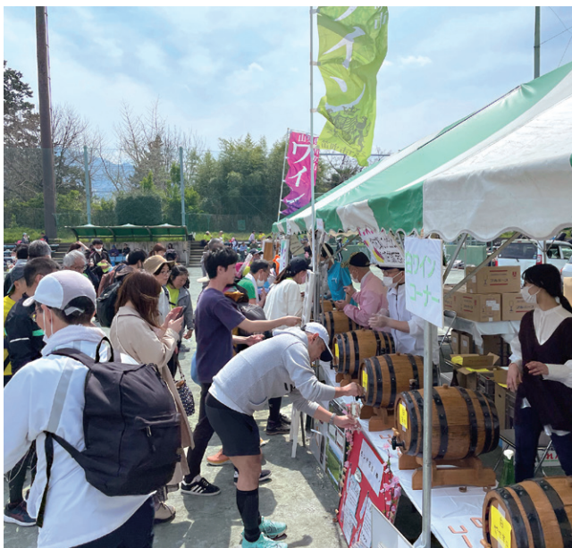
昨年のマラソン大会会場の様子